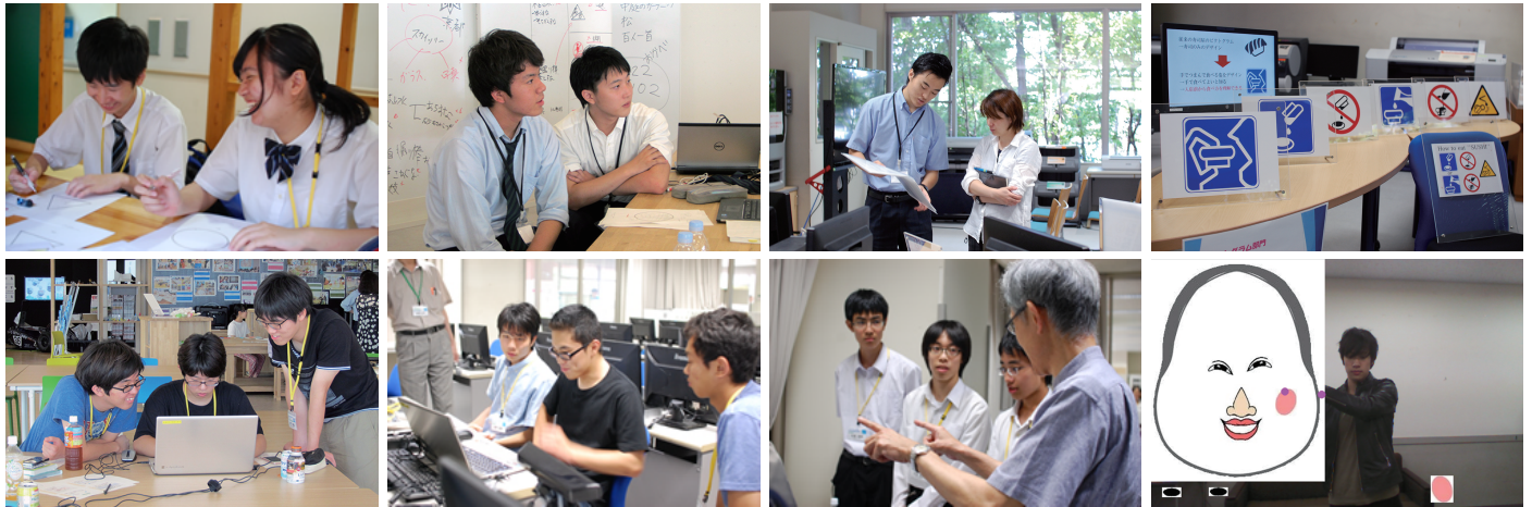
↑ 第1回、第2回の様子(本学の教員や学生と密にコミュニケーションを取りながら課題に取り組みます・ピクトグラム部門(上) プログラミング部門(下))

Microsoft社の「Kinect」を用いて、人の動きに合わせて様々な画像表示を行うことができる、魅力的な「標識表示システム」を創ります。昨年は、「海外の人に日本文化を楽しみながら知ってもらう『電子看板』をC++で作成する」課題を実施しました。これまでに、簡単なプログラミングを行ったことのある高校生であれば、十分にこなせる課題を用意し、必要となるプログラミング技術に関する講義も行います。