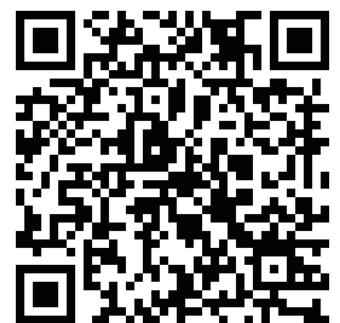
↑ 公式ウェブサイト (QRコード)