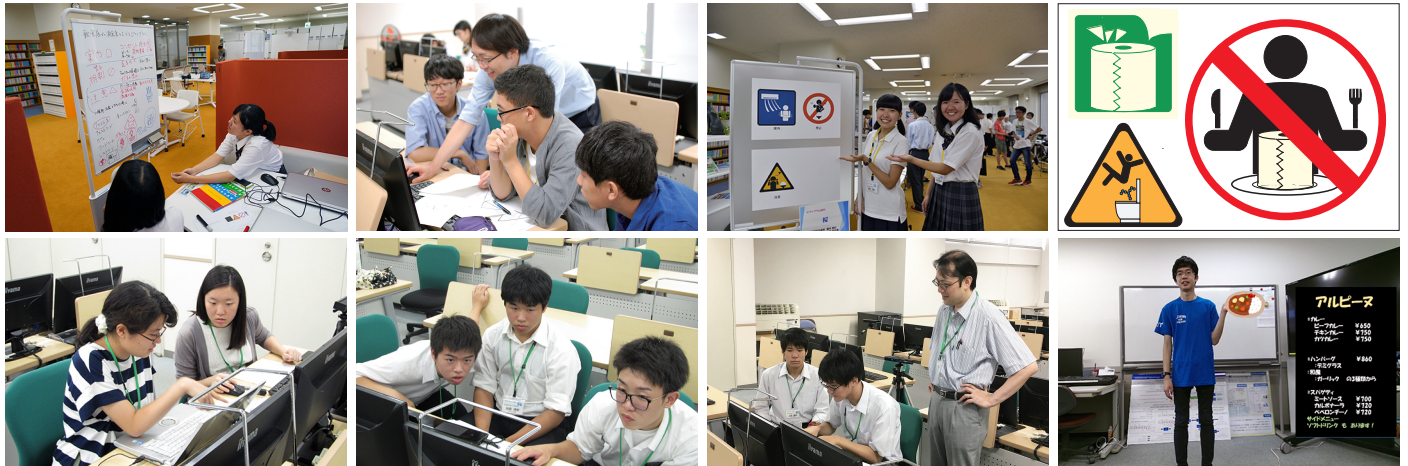
↑ 過去の開催の様子(本学の教員や学生と密にコミュニケーションを取りながら課題に取り組みます・ピクトグラム部門(上) プログラミング部門(下))