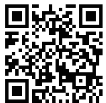
↑ 公式サイト (QRコード)