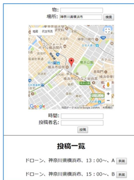
図4 投稿承諾・地図検索

図4は4つの項目を入力し投稿した後の画面を示したものである。投稿された内容は下の投稿一覧に表示される。また、図4のように投稿一覧の神奈川県横浜市という場所の詳細を見るには、地図検索機能で「神奈川県横浜市」と入力すると地図中央にマーカーピンとともに表示される。本システムでは掲示板による文字の共有とチャットルームによる会話、そして地図検索の3つの機能を設けている。